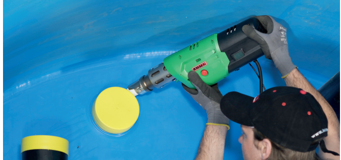
FUSION 1 – meer flexibiliteit bij het lassen dankzij een slank design.